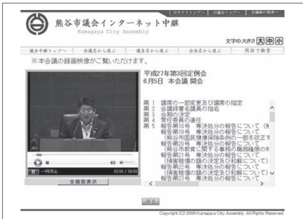
インターネット中継

答 市議会では、本会議の発言を記録した会議録を作成しています。各定例会の会議録は、議会事務局、市役所本庁舎情報公開コーナー、各行政センター、各市立図書館で閲覧できます。また、市ホームページでも昭和58年以降の本会議会議録の閲覧ができます。