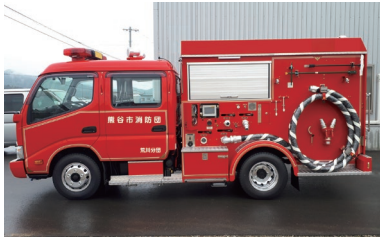
議案第85号「財産の取得について」 (消防ポンプ自動車(CD-I型))

一般議案 では、新たに児童ク ラブを開設するための「熊谷市 立児童クラブ条例の一部を改正 する条例」など16件を提案する。