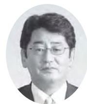
黒澤みちお議員 (民主)