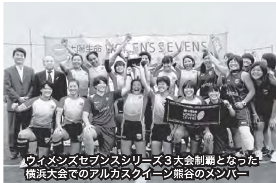
ワイメンズセブンスシリーズ3大会制覇となった横浜大会でのアルカスクイーン熊谷のメンバー

答 立正大学が主体となり、産学官が連携しサポートする地域に根差した7人制女子ラグビーのクラブチームである。