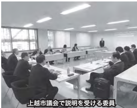
上越市議会での説明を受ける委員

上越市議会では、「議案に対する賛否の公表、委員会中継と委員会会議録のインターネット公開などを実施している。また市民との意見交換会で得た意見を専門的に検討する政策形成システムをつくった。」と説明を受けました。両日とも情報交換や質疑を行い、先進事例の調査・研究を行いました。