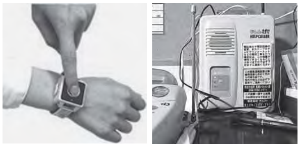
緊急時通報システムの発信機(左)と受信機(右) 発信機のボタンを押すと受信機が受信し、電話回線を通じて消防本部へ通報される