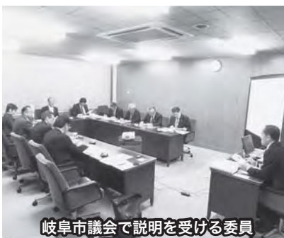
岐阜市議会での説明を受ける委員