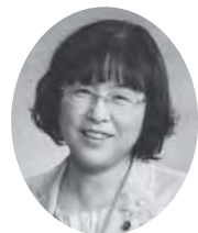
さくらい くるみ 議員 (日本共産党)

多くの高齢者を介護サービスの対象者から外す「医療・介護総合推進法」が平成27年4月から施行される。要支援の方の訪問介護、通所介護は市町村が取り組む地域支援事業に移行することになる。保険給付であれば受給権があり、サービスの利用が予算を超えても打ち切ることにはできないが、事業は予算の制限もある。