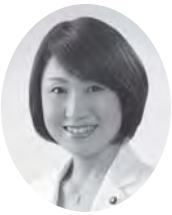
はやし さちこ 議員 (公明党)

問 社会の課題が多様化、複雑化する中、あらゆる分野に女性の力を生かしていくことは国民全体の質の向上につながると思うが、女性活躍推進のためのウーマノミクス創業支援事業の今年度の事業目的と事業内容について伺いたい。