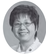
おおやま みちこ 議員 (日本共産党)

全国で自然災害が続ぎ、また雪の心配をしなければならぬ季節となった。平成26年3月議会では、「初動体制の立ち上げが遅く、職員の確保が困難で、除雪等の要望に十分な対応ができなかったことを踏まえ、今後の防災計画やマニュアルに活かす」旨の答弁があった。その後の検討がどのように進んだのか伺いたい。