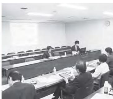
本市暑さ対策の説明を受ける 荒川区議会の皆さん

11月7日 広島県大竹市議会総務文教常任委員会 11月19日 香川県三豊市議会総務教育常任委員会