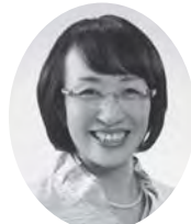
せきぐち やよい 関口弥生議員 (公明党)