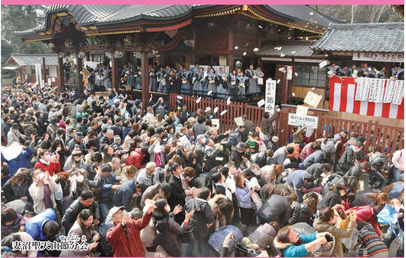
妻沼聖天山節分会

問い合わせ 熊谷市議会事務局 〒360-8601埼玉県熊谷市宮町二丁目47番地1 ☎048-524-1573(直通) E-mail gikaijimukyoku@city.kumagaya.lg.jp http://www.city.kumagaya.lg.jp/shigikai/