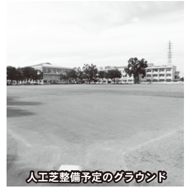
人工芝整備予定のグラウンド

○その他の質問項目 「公共施設庁舎LED化について」「住宅用太陽光発電について」「EVエコカー普及について」