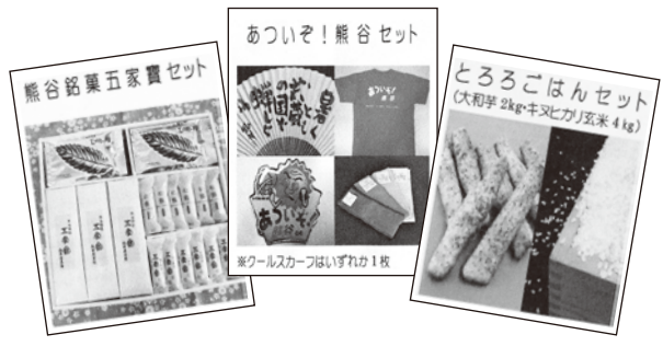
ふるさと熊谷応援寄附金特典制度の贈呈品の一例

品目の中からの選択制としてスタートする。今後も特産品の見直しや寄付金額に応じた品目の導入などの検討を続け、本市の魅力在全国に発信し、地域の活性化を図っていく。 問 雪くまの食事券や聖天様の観覧券など、本市に来ていただくような特典を加える考えはあるか。 答 磯崎議員の御意見も含め、順次、特典の充実を検討する。 問 熊谷市民は本市にふるさと納税ができるか。 答 この特典制度は市外の方を対象としている。 ○その他の質問項目 「市立幼稚園の今後について」