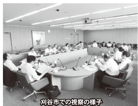
刈谷市での視察の様子

翌9日の愛知県刈谷市では、「先進地視察等を行った中で、基本ベースとなる市議会の決定をし、その基本条例を刈谷市流にどのようにアレンジしていくかというところで検討を行ってきた。検討を行う中で、意見のとりまとめを行うことが難しいと思われる項目を絞り込み、その重点的項目を集中的に検討・意見の調整を行い、その後、他の項目についても意見の調整し、制定した。」との説明を受けました。また、両日とも情報交換や質疑を行い、先進事例の調査・研究を行いました。