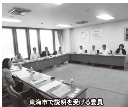
東海市で説明を受ける委員

初日の愛知県東海市では、「議会基本条例の制定に向け、議会基本条例策定特別委員会を設置し、調査研究を始めた。基本条例のモデルとする議会については、複数の候補の中から、視察等、他市議会の条例を参考に、あらかじめ各会派での協議結果を踏まえ、委員会において協議した結果、モデルにする市議会を決定し、より具体的な協議および個別の条文等の作成を行った」との説明を受けました。