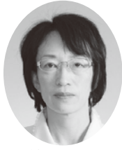
せきぐち やよい 議員 (公明党)