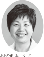
おおやま みちこ議員 (日本共産党)

学力日本一を目指す熊谷市は、教育方針に「知育・徳育・体育」を掲げ、総合的に進めるとしている。全国共通の学力テストの取り扱い方は公表