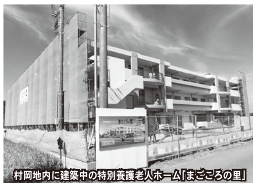
村岡地内に建築中の特別養護老人ホーム「まごころの里」

問 高齢者福祉施設の設置状況について。 答 常時介護が必要で自宅介護が困難な高齢者等が入所する特別養護老人ホームは万吉に立正たちばなホーム、津田にサンヴェイレッジ、野原に虹の郷の3施設があり、来年4月には村岡に1施設が開設予定。病状が安定しリハビリに重点を置いた介護が必要な方を対象とした介護老人保健施設