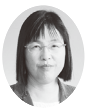
さくらい くるみ議員 (日本共産党)