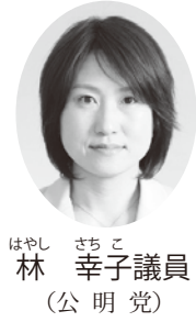
はやし さちこ 議員 (公明党)