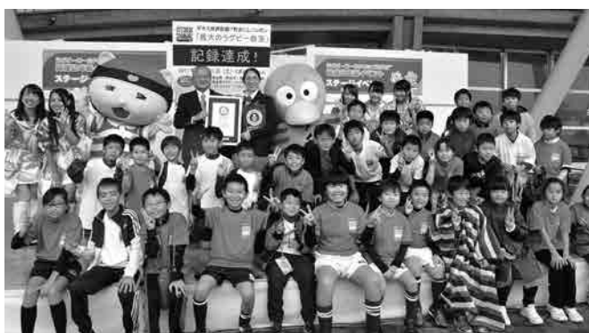
平成29年10月21日に開催されたラグビーイベント (ギネス世界記録に認定された「最大のラグビー教室」)

問 ラグビーワールドカップ推進事業に おける、テストイベントはどのようなもの を想定しているのか伺いたい。