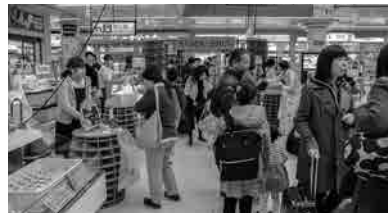
平成29年11月1日に熊谷駅で開催したイベント「熊旬」の様子

連携してイベント等を開催した際の補助で、補助率が2分の1、上限が50万円である。補助対象となる経費は、需用費、報償費、使用料および賃借料、委託費、その他共同販売に必要な経費等である。なお、平成29年度までは、商業振興事業の一部であつたが、非常に好評だったこともあり、平成30年度からは、事業として独立させて予算計上した。