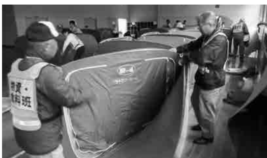
避難所開設・運営訓練において居室の間仕切りを組み立てている様子

また、訓練から確認できた避難所開設の流れや役割分担等をフローチャートにし、小学校に備えるなど、災害時にも地域と連携し、円滑に避難所を開設・運営できるよう努める。(危機管理室)