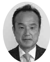
野澤久夫議員 (清新会)