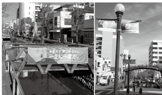
ラグビーワールドカップ2019の全国統一バナーで飾られた市街地