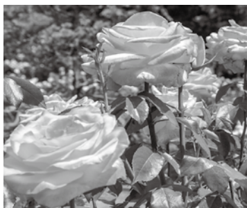
見ごろを迎えた道の駅めぬまのバラ

本号では、一般質問や各常任委員会質疑など、3月定例会での議会の活動のほか、農業振興特別委員会およびスポーツ・観光特別委員会が行った行政視察に関する報告などについて掲載いたしました。これからも、より身近な、そして、わかりやすい市議会だよりを目指してまいります。