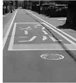
通学路交通安全対策事業

小学校、中条小学校、新堀小学校、石原小学校、成田小学校、吉岡小学校である。 (所管課・維持課)