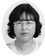
議員 桜井くるみ (日本共産党)

健康を維持する、健康を増進する、予防に力を入れる市の取り組みが重要になってきている。保健師は「健康」のリーダーである。この7年間、保健師の採用がないが、増やすべきである。