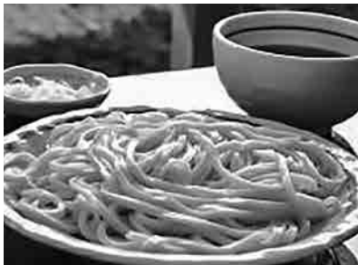
熊谷産小麦を使用したうどん

当日は、くまがや農業協同組合本店において、吉田代表理事組合長から、新規就農支援、熊谷産小麦の生産拡大への対応等、農業振興に係る現状と諸課題について説明を受け、同組合との間で、関連分野について幅広い意見交換を行ったほか、JAくまがやふれあいセンター箱田店内の直売所を見学しました。