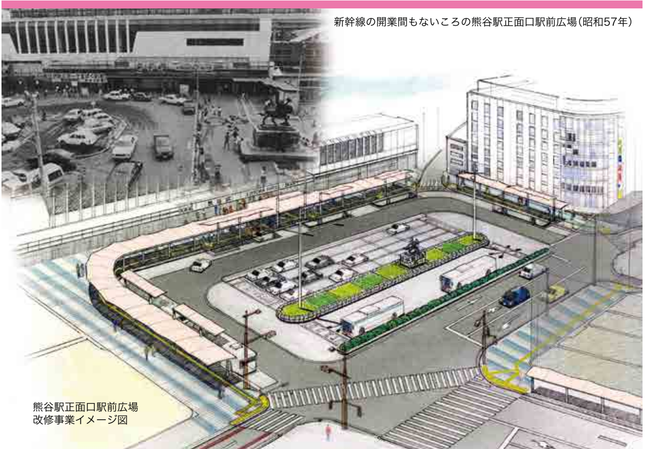
新幹線の開業間もないころの熊谷駅正面口駅前広場(昭和57年)

問い合わせ 熊谷市議会事務局 〒360-8601埼玉県熊谷市宮町二丁目47番地1 ☎048-524-1573(直通) E-mail gikaijimukyoku@city.kumagaya.lg.jp http://www.city.kumagaya.lg.jp/shigikai/