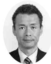
もりや 純議員 (公明党)