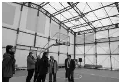
アリーナの壁面、屋根が白い生地のため、プロジェクトマップも映えるとのこと。

初日には、茨城県水戸市を本拠地とするプロバスケットボールチーム、茨城ロボッツが手がける「まちなか・スポーツ・にぎわい広場(MISSPO)」について視察を行いました。水戸市では商店街の中心にあつたデパートが撤退してから約20年間、空き地になっており、その場所にアリーナやスタジオ、ショップ、カフェなどを茨城ロボッツが中心となり水戸出身の実業家や水戸市と連携し、整備したとのことでした。アリーナは、選手がバスケットの練習を行うだけでなく、雨天時に保育園が運動会を開催するなど、地域の方からも身近な施設としてにぎわっているとのことでした。水戸出身の企業経営者が、以前に比べ、にぎわいがない地元をどうにか盛り上げたいとの思いで、「水戸ど真ん中再生プロジェクト」を立ち上げたことが、MISSPOの整備のきっかけとのことでした。プロジェクトには、地元の方や出身者だけでなく、さまざまな企業も参画し、地方創生のモデルとなるよう活動しているとの説明を受けました。