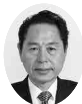
むらかずお 三浦和一議員 (公明党)