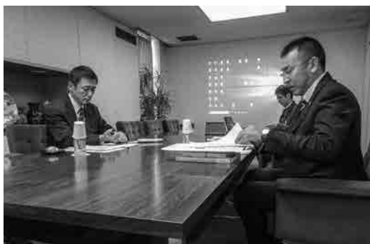
1/26 東京都葛飾区議会の視察の様子

■1月26日 東京都葛飾区議会 会かがやけ Katsushika・維新II英語教育ラウンド システムについて