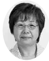
おおやま みちこ 議員 (日本共産党)

市長の政策提言の中に、個人住宅の居住環境の向上と地域経済の活性化を図るため、住宅リフォームに係る費用の助成が掲げられたが、この制度については、これまで議会で取り上げるなどしてきた。