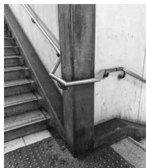
籠原駅南口の階段の手すり