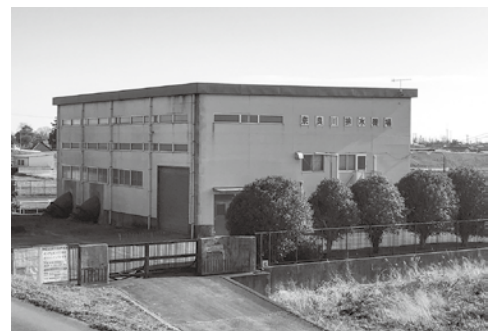
改修される奈良川排水機場

13日には、議員提出議案1件を原案どおり可決しました。最終日(20日)の本会議では、各常任委員長から案件審査の経過および結果が報告され、質疑、討論を行いました。追加で提出された議案を含め、市長提出議案の全て及び委員会提出議案について原案どおり可決しました。