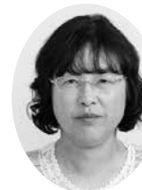
桜井くるみ議員 (日本共産党)

平成28年3月に「熊谷市地域公共交通網形成計画」が策定された。期間は7年間。計画に基づいて実施された事業や見直しのポイントは。答 4月に6カ所のバス停を新設したほか、地域公共交通網形成計画に基づき、速達性向上や効率化、循環型から往復型への運行方式等の見直しを検討する。