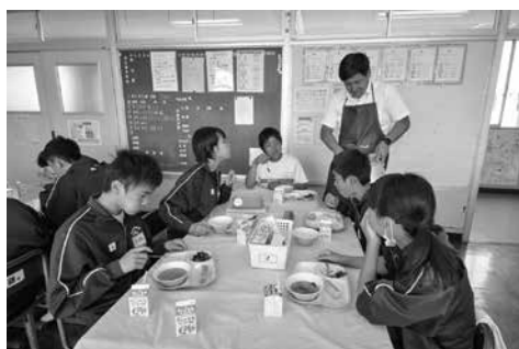
大幡中での給食の様子