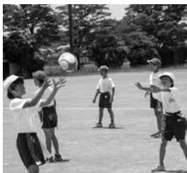
タグラグビー普及啓発事業

答 将来人口については、減少が見込まれる中、具体的な数値目標を掲げることは適切ではないと考えている。総合戦略の推進により、人口減少の抑制を図る。 (企画課)