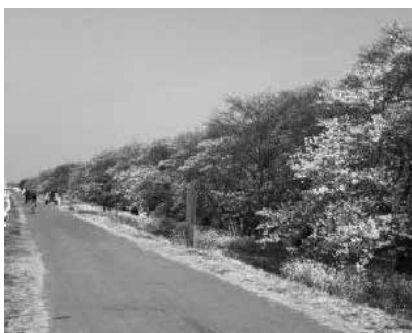
江戸時代から親しまれている熊谷桜堤

検討会議を2回行った。本拠地にふさわしい練習環境の整備や周辺開発の可能性、アクセス利便性の向上、集客力の向上が課題である。 (2)「さくらのまち熊谷」について 問 熊谷の桜の現状についてと今後の計画は。 答 高齢化した桜も多く、植え替えを行っているが、今後は熊谷市みどりの基金を活用し、専門的な診断を実施し適正な管理に努める。また、長期間、桜を楽しめるよう、熊谷桜など開花時期の異なる品種の計画的な植樹を検討する。これからは熊谷の桜が観光の柱となるよう、後世につないでいく。