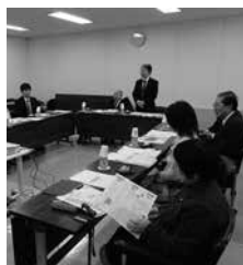
10/31 福岡県久留米市の視察の様子

■10月31日 福岡県久留米市議会教育民生常任委員会Ⅱスポーツ振興を通じたまちづくりについて