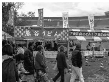
全国ご当地うどんサミット 2017 in 熊谷