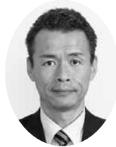
もりやあし淳議員 守屋淳議員 (公明党)