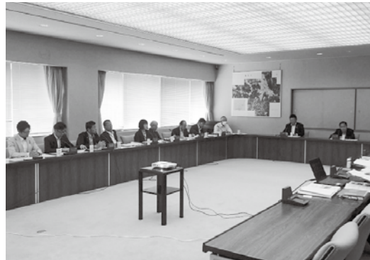
亀岡市議会での視察の様子

初日には、岐阜県多治見市において、「議員間自由討議」などについて視察しました。多治見市議会では、常任委員会での議案についての質疑の終結後、議員のみで意見交換しながら討議を行い、考えを確認しています。また、議案以外についても、市の課題などを議員全員で共有した際には、討議テーマを議長に提案し、全員協議会で討議することでした。今までの議会では、執行部に対する質疑が中心でしたが、市民の多様な意見の代表者として、議員