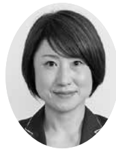
こやま さちこ 議員 林幸子議員 (公明党)