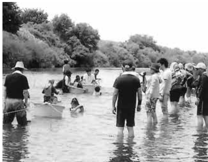
新川ふれあいワンデイキャンプ

問 新川地区の荒川の堤外にある河川区域で国から占用許可を受けている方はいるのか。また、占用者がいる場合の面積は。