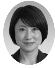
議員 幸子 林 (公明党)