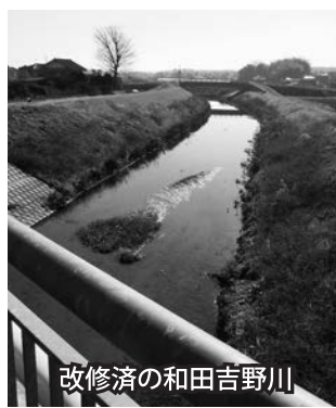
改修済の和田吉野川

蛇行した河道を短縮するため新しく掘削して、なるべく直線的に開かれた水路。湾曲が著しく勾配がゆるやかな場合、河水が円滑に流下せず滞留しがちとなり、洪水の一因となることがあるが、捷水路を設けることにより洪水疎水能力を増加させることができる。