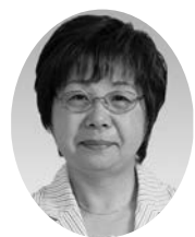
議員 大山美智子 (日本共産党)

市ではこども医療費助成について制度を拡充し全県をリードしてきた。しかし年齢拡大に伴い、市税等の完納要件を加えるとしているが、子供に係る助成制度に完納要件を付けるべきではない。親の経済状態で子供を差別することは制度の目的と合致せず、子供の健康が心配である。朝霞市や寄居町では要件を付けず18歳まで拡大。熊谷市も計画を見直し、どの子ども利用できる制度にするよう求め質問。 問 こども医療費助成制度の目的およびこれまで拡大してきた理由は。