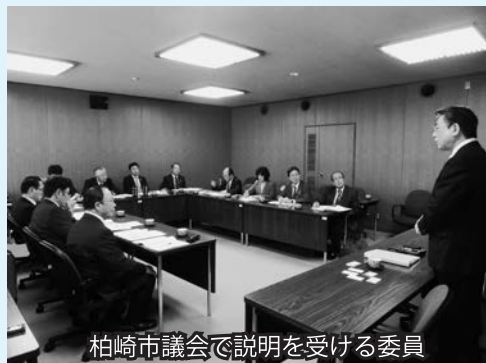
柏崎市議会にて説明を受ける委員

翌日の石川県金沢市は、定例会の回数を年1回とし、会期を6月から翌年3月までとする通年議会を平成26年度から採用しました。「通年議会導入に当たり課題となった、市長の専決処分の取り扱い、市長部局と議員との協議・精査し、所要の改正を行い、また、一事不再議の運用や発言の取消しまたは訂正については、会議規則の一部変更の改正を行った。将来的には、柏崎市と同様の通年会期制の導入を目指している。」という説明を受けました。