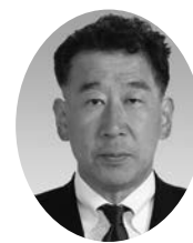
議員 中島 勉 (熊志会)