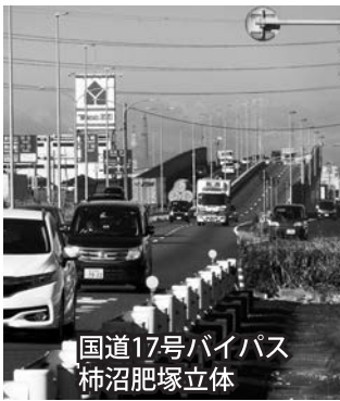
国道17号バイパス 柿沼肥塚立体

落ち葉等を使った資源循環型社会を考える ―簡易落ち葉コンポストの設置を促進したい―