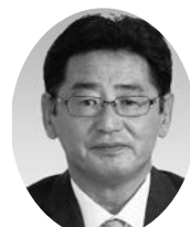
たくし 黒澤 議員 くろさわ みちお (市民社会民主党)

問 市内で発生した殺人事件以降検討されている熊谷モデルについて、本市としてどのような課題を把握し、どのような構想で対応しているのか。