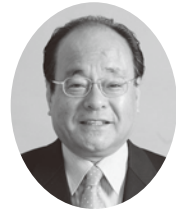
栗原健昇議員 くり はらけんしやう