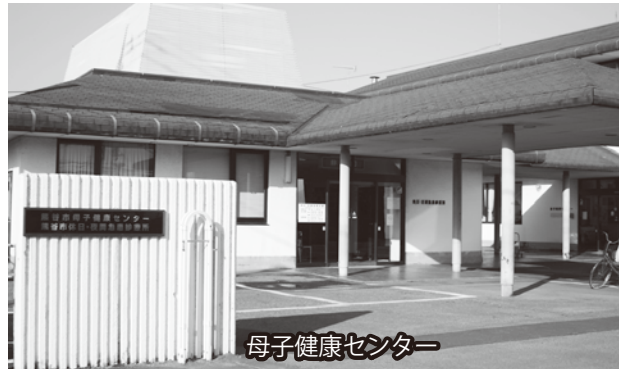
母子健康センター

や相談に応じている。また、医療側としては、接種時の予診票記入の際に、副反応等を説明し、保護者の同意を得ている。③現段階では判断できないが、これらのワクチンの予防接種については、定期接種への移行も含め、国で議論を進めていることや、自治体での多額の財政負担も想定されることから、今後、国の動向を注視するとともに財政状況を勘案して検討していきたい。 (健康づくり課) ○その他の質問項目 「東日本大震災による屋根瓦の被害について」