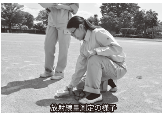
放射線量測定の様子

測定器を、直接、市民の皆さまへ貸し出すことは考えていない。③今後の放射線測定結果の公表については、測定結果を迅速にお知らせするには、市ホームページを活用することが、最も有効な方法であると考えているが、市報でもお知らせしていく予定である。また、太陽光発電設置補助については、昨年度、今年度と予算を増額して対応してきた。県内でもトップクラスの予算額となっており、今後も、太陽光発電の普及に努めていきたいと考えている。 (環境政策課) ○その他の質問項目 「特化しない住宅リフォーム助成制度を」