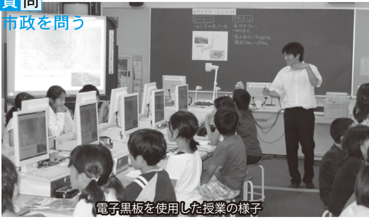
電子黒板を使用した授業の様子

学習活動を補助するために活用され、多くの場合、画像や資料などの提示であるが、学習する上で実物に触れたり、ノートにまとめたりすることが極めて有効であることから、必要に応じて、それらの活動と組み合わせ、電子黒板を活用することが肝要であると考えている。