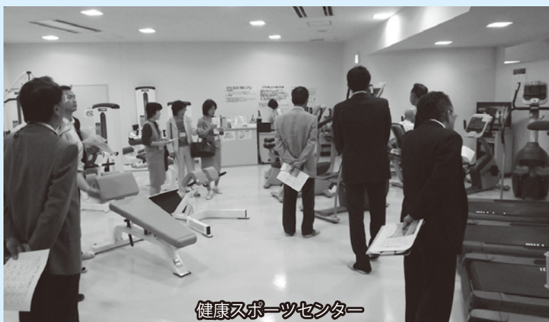
健康スポーツセンター