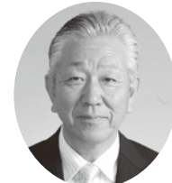
須永 宣延 議員