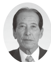
こばやし しんいち 議員 小林甚一