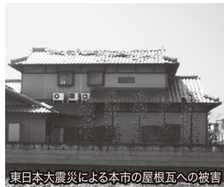
東日本大震災による本市の屋根瓦への被害

14日には、総務文教常任委員会及び福祉環境常任委員会において、また、15日には、都市建設常任委員会において、付託された議案についてそれ