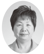
おやまみ ちこ 議員 大山美智子