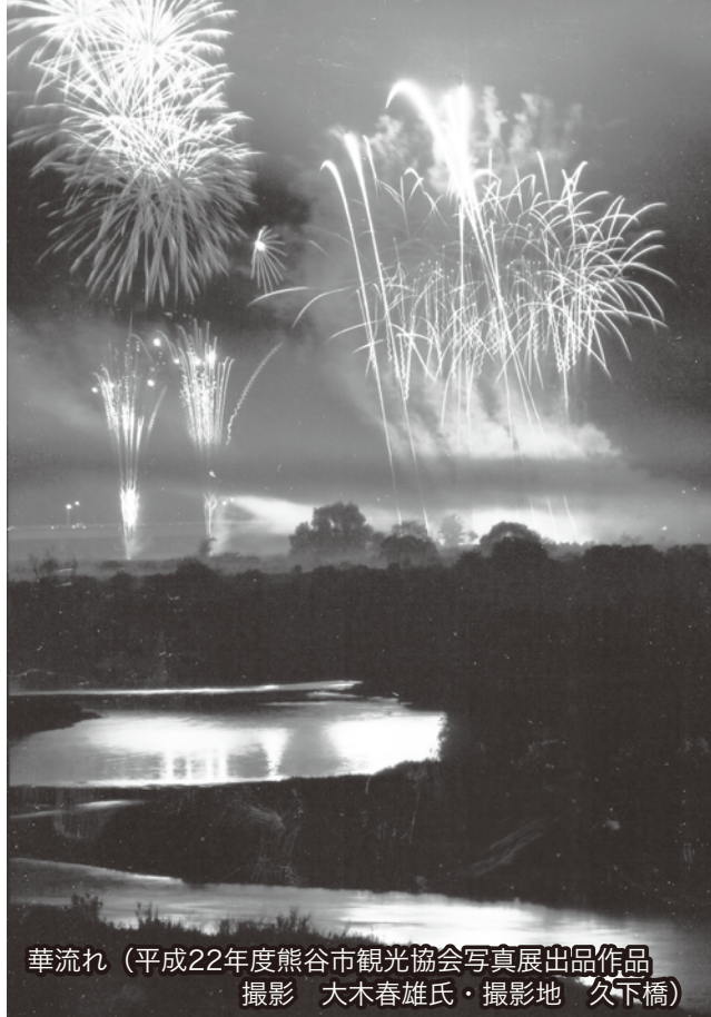
華流れ（平成22年度熊谷市観光協会写真展出品作品） 撮影 大木春雄氏・撮影地 久下橋