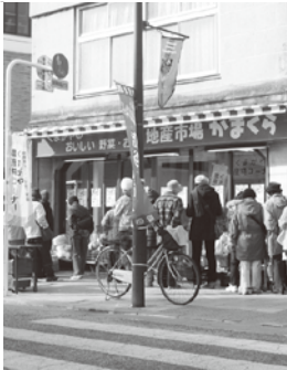
地産市場かまくら

②今後、大手資本は中小規模 の店舗で中心市街地へ回帰を するという分析もある。また、 高齢化により消費者の行動半 径が狭くなることも考えられ、 都心回帰傾向も期待できる。 本市は、中心市街地に駐車場 を持つ大型店が立地しており、 近年マンション建設も進み居 住人口も増加傾向となってい る地区もあることから、これら を見据えた商業活性化に取り 組んでいるが、一方で、商店 主の高齢化等で廃業する事業 所も増加し、商店街組織の維 持に先行きの不安定要素も懸 念される。③事業者の地元商 店街への参加は、地域の魅力 ある商業環境づくりに重要で ある。熊谷市商店街連合会が、 これまで果たしてきた役割や 今後の展望を考えると中心市 街地活性化の担い手としても 重要な役割が期待される。本 市の商業振興のため、他市の 事例を踏まえ、ご提案の商店 街等加入努力規定等について 検討していきたい。 (商業観光課)