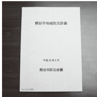
熊谷市地域防災計画

① 今回の大震災では、新幹線などの交通機関がストップしたことから帰宅困難者を「さくらめいと」において、受け入れた。課題としてあげられる鉄道事業者との連携と協力体制の強化、帰宅困難者への情報提供方法について、見直していく。② 埼玉県地震被害想定調査に基づく本市の帰宅困難者は、深谷断層による地震が発生した場合、約3万人と予測されている。この調査における帰宅困難者の定義は、熊谷市民が市外へ外出し、地震が発生したため自宅へ戻って来られない方