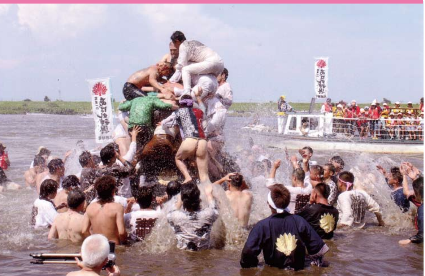
これぞ祭りだ (平成22年度熊谷市観光写真展出品作品：撮影地 葛和田渡船場)

問い合わせ 熊谷市議会事務局 〒360-8601埼玉県熊谷市宮町二丁目47番地1 ☎048-524-1573(直通) E-mail gikaijimukyoku@city.kumagaya.lg.jp http://www.city.kumagaya.lg.jp/shigikai/