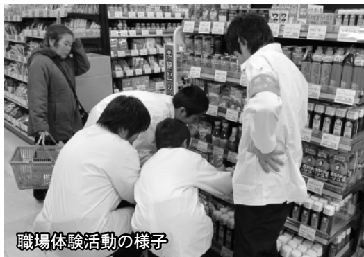
職場体験活動の様子