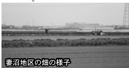
妻沼地区の畑の様子