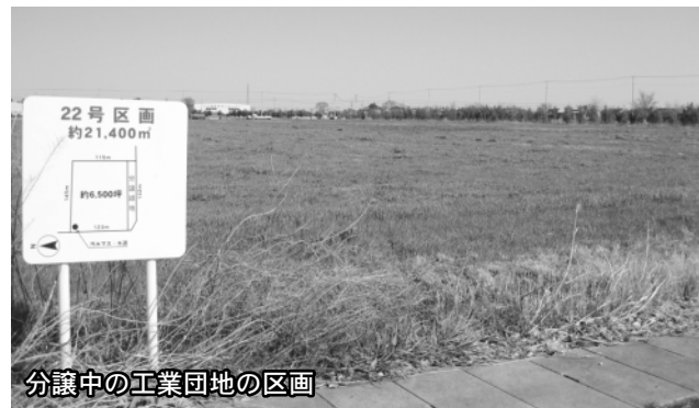
分譲中の工業団地の区画