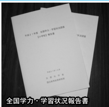
全国学力・学習状況報告書

全国学力・学習状況調査について①本市で抽出された学校は小学校、中学校それぞれ何校あるか②抽出されなかった学校は希望参加するのか、しないのか。また、その理由について③希望参加するか、しないかの決定にあたって、保護者の意見は聞いたのか、それぞれ伺いたい。