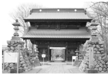
妻沼聖天山（貴惣門）

問 平成22年度予算の商工費において、地元の業者や商店街が活気づくために工夫したところ、また、新たに実施する事業等があるのか、伺いたい。