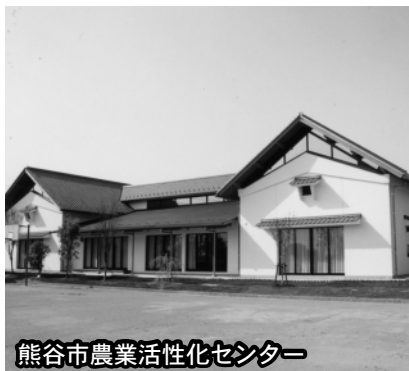
熊谷市農業活性化センター

◇熊谷市農業活性化センター条例の一部を改正する条例 ◇熊谷市農業研修センター条例の一部を改正する条例