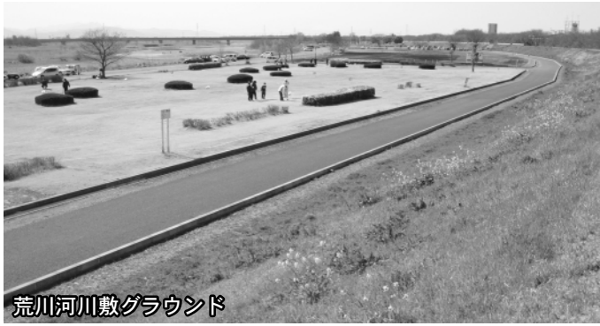
荒川河川敷グラウンド

とも休日にはほぼ満杯で、平日もグラウンドゴルフなどでも利用され、年々増加傾向にある。③河川敷の保全と利用の調和を図りつつ、利用傾向を調査研究していきたい。④河川空間の環境の保全と利用を適正に行うため、荒川流域の動向や将来の見通しを踏まえ、長期的展望にたつて計画されたもので、保全ゾーン、緩衝ゾーン、利用ゾーンを設定して管理の方針を示している。