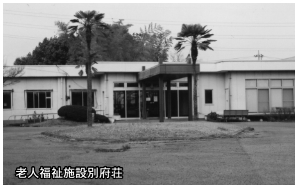
老人福祉施設別府荘

として高齢者のニーズに対し一定の効果を上げていると認識している。③本来の銭湯としての機能に加え、温泉や各種の機能を備えた浴槽を配置するなど、世代を超えて家族ぐるみで楽しめる公衆浴場として認知され、利用されていると認識している。④他の自治体での実例を調査し、実現可能な施策であるか研究していきたい。⑤磐田市で導入する制度については、地元商業の活性化という視点から考えると、効果のある制度ではないかと考える。 (長寿いきがい課) ○その他の質問項目 「市営住宅の駐車場について」