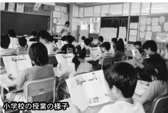
小学校の授業の様子

①平成20年度末の整備率が76.5%となっている。これは、総合振興計画および中期経営計画における平成20年度の計画値75.7%を上回っている。今後は経営の効率化やコスト縮減に努め、経営基盤の強化を図りつつ、地元の要望も考慮しながら、事業効果の高い地区を重点的に実施し、引き続き、計画値を上回るペースで推進できるように努力していく。②接続済人口の割合を示す水洗化率は、平成20年度末で、本市全体では