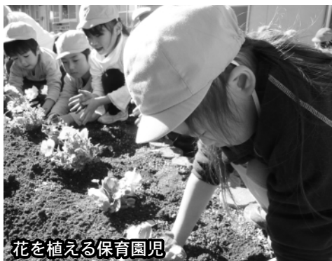
花を植える保育園児

◇国に対して、民間保育所運営費の一般財源化に反対し、また、全国一律の最低基準の維持を求める意見書の提出を求める請願 (審査結果・採択)