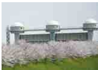
和吉野川下流部にある玉作水門

答 国では、平成13年に荒川の洪水の逆流を防止するため玉作水門を建設した。県では、時間雨量50ミリの激しい降雨を安全に流下させることを目標に、全延長11・2キロメートルのうち、29年度末で、約5.6キロメートルの区間の整備が完了し、現在、さらに上流の整備を進めている。(危機管理室、河川課)