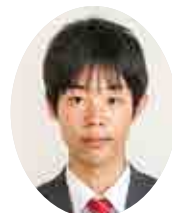
議員 裕理 鈴木 まさひろ すずき 会派:清新会

いじめ・不登校・児童虐待など、子どもに関わる問題は依然として大変憂慮すべき状況である。そうした困難な状況にある子どもや家庭に対し、福祉の視点から、必要な機関への橋渡しや幅広いサポートを担う「スクールソーシャルワーカー」の持つ役割に、全国の教育現場で大きな期待が寄せられていることを踏まえ、質問を行う。