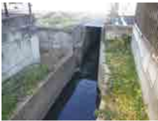
宅地化が進んだ地域での水路

答 水路の環境を改善するためには、下水道の整備と、接続の普及促進に努めるとともに、沿線の皆様の総意としての要望によって、水路改修をすることが考えられる。 (河川課)