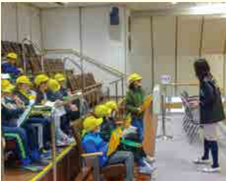
市議会議場の傍聴席でバリアフリーなどについて質問をする小学生

2月18日に、熊谷西小学校の4年生21人が、総合の学習「バリアフリーを探して」の一環で市議会議場を訪れ、傍聴席入口に設置してある車椅子用リフトの乗車体験や、議会についての説明を受けました。