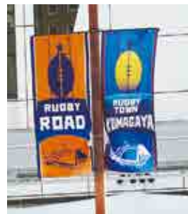
ラグビーロードに設置されたバナーフラッグ

と、官民一体でラグビーによるまちづくりを推進するもので、こうした取り組みが大会のレガシーになると考える。