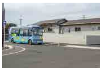
ソシオ流通センター駅前

問 「総合戦略」池上地区「道の駅」整備事業が繰越明許になった理由について伺いたい。