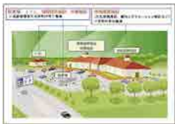
一体型「道の駅」イメージ (熊谷市「道の駅」基本構想より抜粋)

答 重点「道の駅」は、国が地域活性化の核として優れた道の駅を選定し重点的に応援する制度で、複数省庁の交付金制度の活用について、国土交通省がワンストップ相談窓口として対応する等のメリットがあることから、本市でも基本計画策定後、国土交通省と協議し、重点「道の駅」への応募を予定している。なお、行田市が既に候補として選定されているが、本市への影響はない。