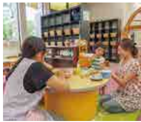
子育て支援センター「ベアリス」 （立正大学熊谷キャンパス内）