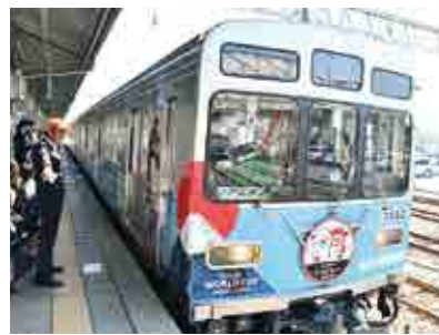
ラグビーワールドカップ2019をPRするためのラッピングトレイン

ラグビーワールドカップ2019開催都市決定から4年間、ハード、ソフト両面からさまざまな準備を進め、開催都市としての機能を高めてきた。大会会場へのアクセス道路網の整備も順調に進み、また、熊谷駅正面口駅前広場についても工事が最終段階に入り、ユニバーサルデザインや暑さ対策に配慮した姿に生まれ変わる。9月の大会本番に向け、お客様が安心して快適に楽しんでいただけるよう、準備に万全を期すとともに、本市を訪れるお客様に熊谷の魅力を肌で感じていただき、また熊谷を訪れたいと思ってもらえるよう、市民やボランティアの皆様と一丸となって「熊谷らしい温かいおもてなし」でお迎えする。 ことしは5月に新天皇が即位され、「平成」の幕が閉じ、新たな時代が始まろうとしている