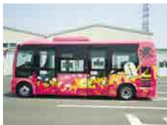
ゆうゆうバス さくら号