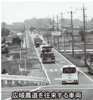
広域農道を往来する車両