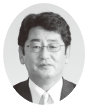
議員 黒澤 三夫 （民主）