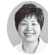
議員 大山美智子 (日本共産党)

放課後の過ごし方にはいろいろあるが、学童クラブに入っていない子供たちの過ごし方として、学校の先生とのかかわりや普段はできない異年齢の子供たちとの触れ合いもでき、有意義な過ごし方をしているハートフル学級は、一部の地域で行われていない。子供たちが楽しいと感じる事業ならば、希望する子供たちが、どの地域の誰でも参加できるようにすることが本来の姿なのではないか。