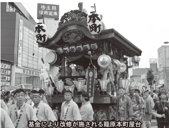
基金により改修が施される籠原本町屋台

地球温暖化対策の一環として、太陽光発電システムや家庭用燃料電池システム(エネファーム)による「創エネ」設備、LED照明等による「省エネ」設備、家庭用蓄電システムによる「蓄エネ」設備、エネルギー計測装置(HEMS)による「エネルギーの見える化」設備等を有する住宅を、市内に新築または購入した方に対する補助を市が行うものです。