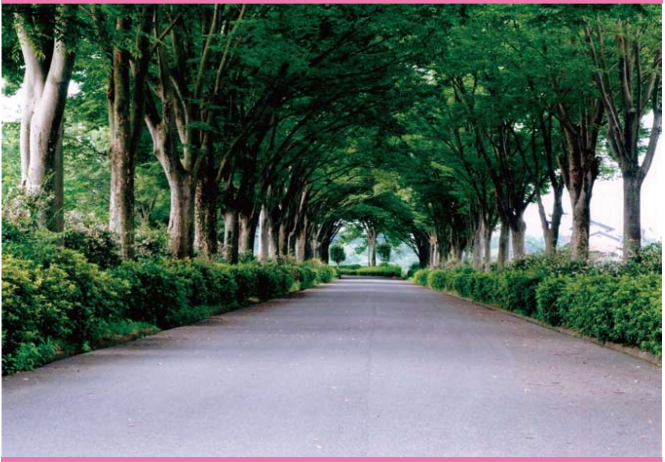
けやき並木 (第3回くまがや景観写真展応募作品：撮影地 御正新田)

問い合わせ 熊谷市議会事務局 〒360-8601埼玉県熊谷市宮町二丁目47番地1 ☎048-524-1573 (直通) E-mail gikaijimukyoku@city.kumagaya.lg.jp http://www.city.kumagaya.lg.jp/shigikai/