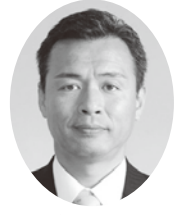
もりや あつし 議員 守屋淳明 (公明党)