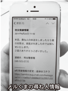
メルくまの尋ね人情報

答 福岡県大牟田市のほか、県内でも志木市において取り組みが始まっているのでこれらの事例を参考にし、研究していきたい。(広報広聴課・長寿いきがい)