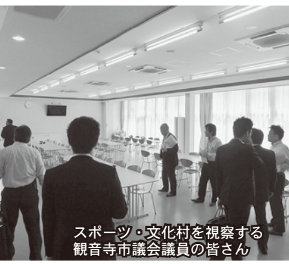
スポーツ・文化村を視察する 観音寺市議会議員の皆さん

5月23日 香川県観音寺市議会 文教民生常任委員会 スポーツ・文化村整備プロジェクトについて