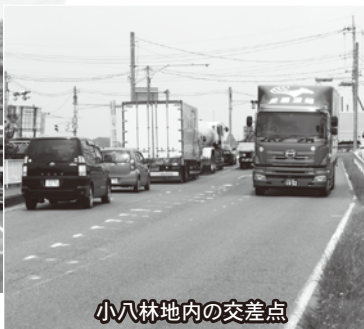
小八林地内の交差点