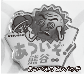
寄附者への贈呈品