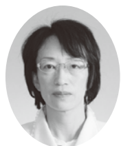
議員 関口 弥生 （公明党）