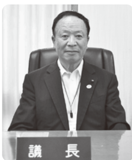
議長 森 新一