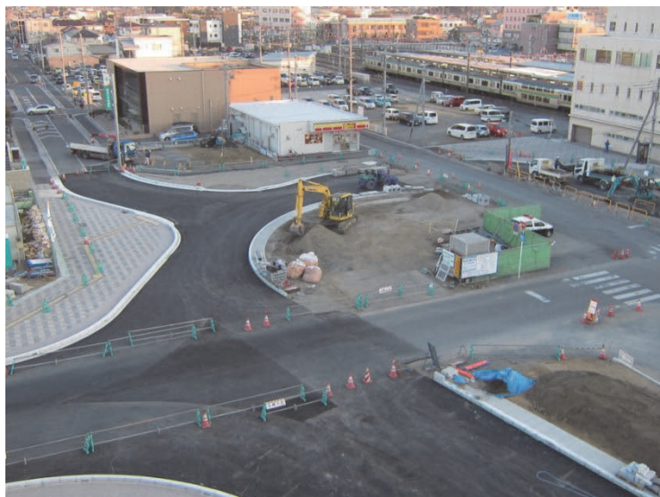
土地区画整理事業（籠原中央第一地区 籠原駅北口駅前広場）