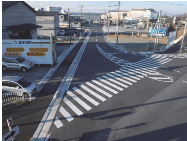
市道 90096 号線 (吉岡工業団地内)