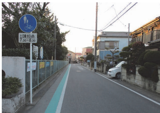
通学路の交通安全対策（グリーンベルト）