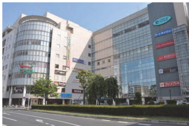
市街地再開発事業