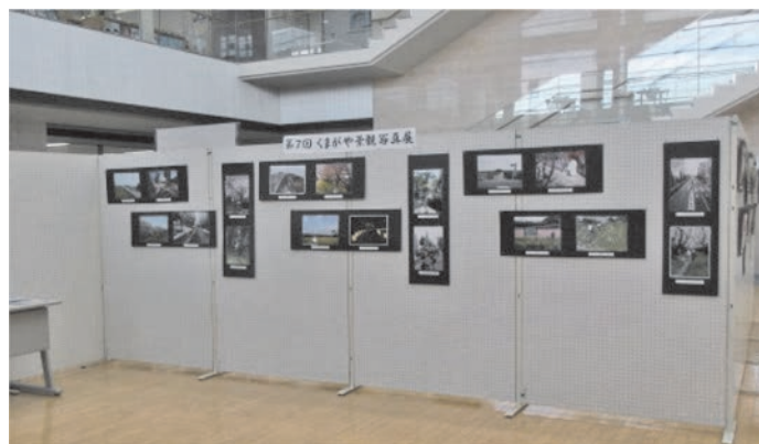
くまがや景観写真展（展示の様子）

屋外広告物の規制・誘導に当たっては、熊谷市景観計画との連携が必要なため、市独自の屋外広告物条例の策定及び景観計画の見直しが必要です。