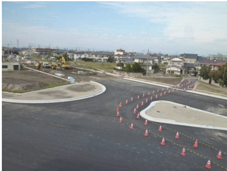
土地区画整理事業（上之地区 熊谷谷郷線及び第2北大通線）