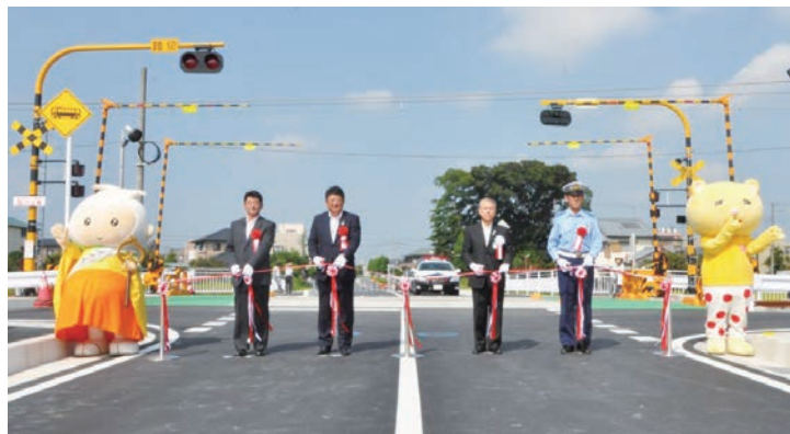
幹線第3号線道路開通式