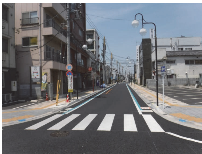
市道 80034 号線 (弥生町)