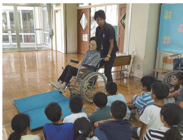
心のバリアフリーの普及・啓発（車いす体験）