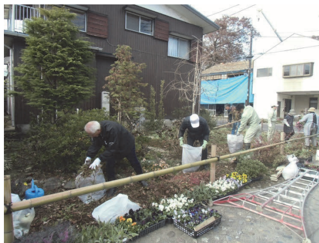
聖天山周辺地区景観ワークショップ