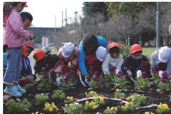
公園サポーター等による清掃や花植え活動