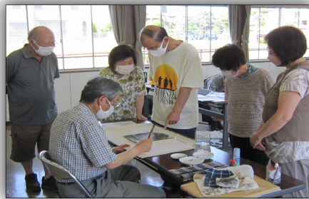
とある日の活動風景