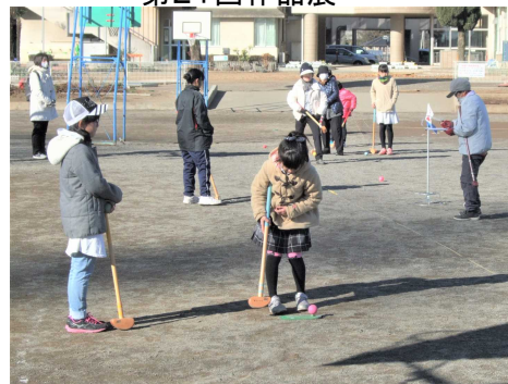
3世代交流グランドゴルフ大会