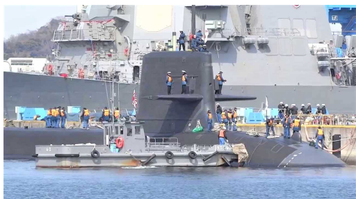
横須賀軍港めぐりでの1シーン