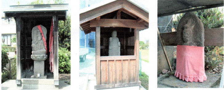
① 二十一夜供養塔 ② 地藏菩薩 ③ 二十一夜供養塔

大幡には3つのお地藏さまと、5つの二十一夜さまがあります。このうち、2か所は2つの神さまが祀られています。