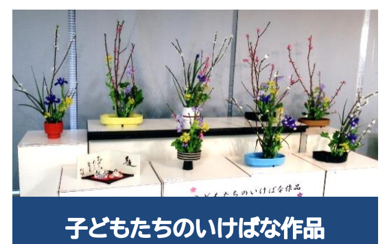
子どもたちのいけばな作品

登録団体への見学・入会等 各種お問合せは 江南公民館まで (電話) 536-6262