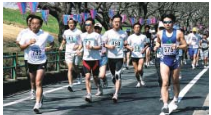
第15回-熊谷さくらマラソン大会

沿道の声援はランナーの励みになります。 市民の皆さん、大会の盛り上げにご協力をお願いします。