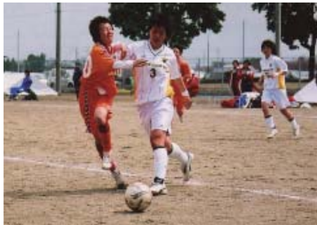
第11回めぬまカップ

とき 3月26日(日)~29日(水) 9:00~16:00 29日は13:30まで ところ 妻沼運動公園・利根川総合運動公園サッカー場