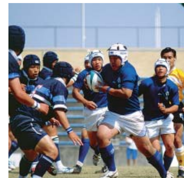
第6回大会決勝戦 啓光学園(青)VS東海大仰星(紺白)