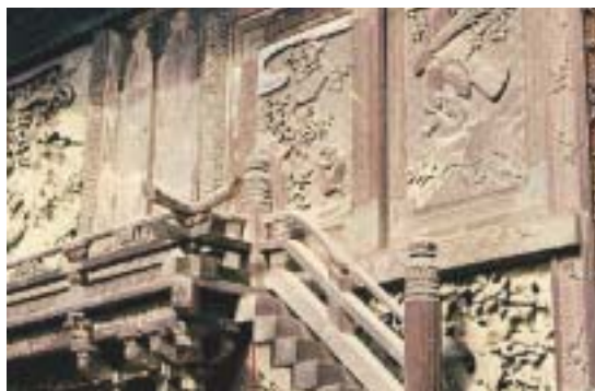
聖天堂奥殿(本殿)彫刻