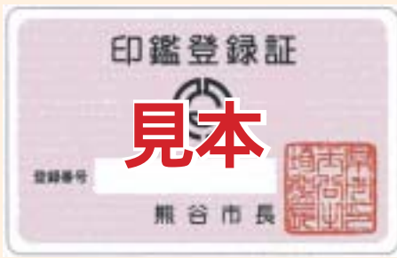
新「熊谷市」の印鑑登録証

旧大里町および旧妻沼町で登録した印鑑登録証は、印鑑登録証明書が必要な時に、本人確認をしたうえで新「熊谷市」の登録証に引き換え交付します。