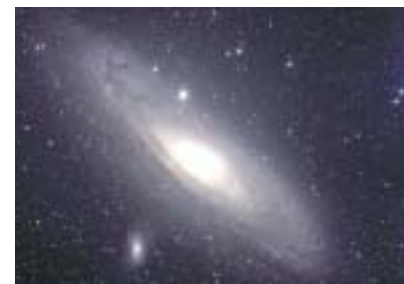
230万光年彼方(かなた)のアンドロメダ銀河

「火星の世界」(投影期間 10/16日 まで) 「アンドロメダ銀河への架け橋」(投影期間 10/25火~12/25日 まで)