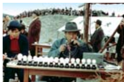
ロケット発射を指揮する糸川博士