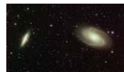
おおぐま座の銀河M81(右)・M82(左)