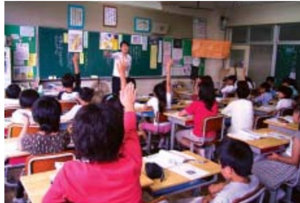
小学校における道徳授業

Q 独自の学力調査とは？ A 一つは、学習到達度調査で小学校五年生、中学校二年生の四月に、それまでの基礎学力の獲得状況を教科書から作った問題で調べます。もう一つは、総合学力調査で、中学校三年生で二回学力の獲得状況を調査します。この場合、教科書の問題をそのまま使うことはありません。どちらの調査も、熊谷市で独自に作成した問題で実施します。