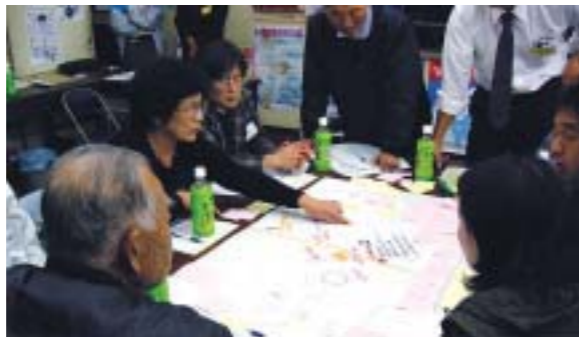
市民プランニングサポーター会議

公益的市民活動団体の支援を行うとともに、パートナーシップ・マニュアル、協働事業提案制度の導入等の検討を行います。