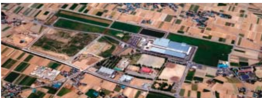
妻沼西部工業団地

企業誘致の促進 (122万円) 企業立地を促進するための産業立地促進条例を制定するほか、企業情報および就労支援のためのサイトをネット上に開設します。