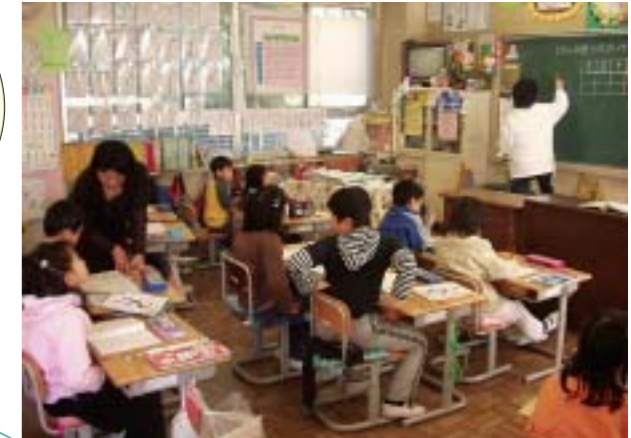
学力向上補助員と協働で行う授業