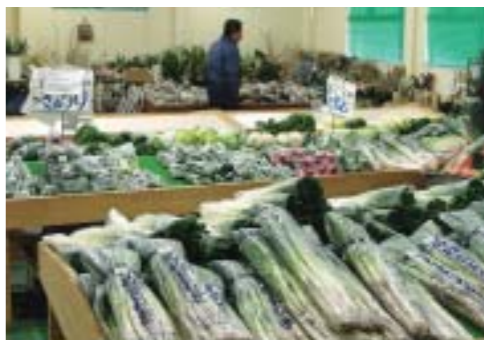
めぬま物産センター