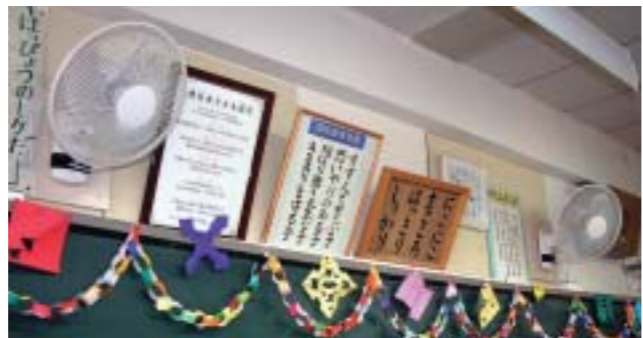
壁掛式扇風機 (熊谷西小学校)

久下小学校・奈良中学校・大里中学校の耐震診断および市田小学校・妻沼東中学校・妻沼西中学校の耐震設計を行います。