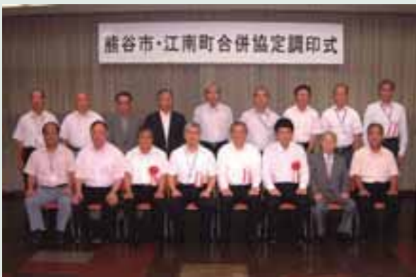
熊谷市・江南町合併協議会委員の皆さん