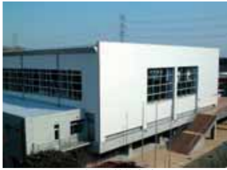
江南中学校体育館