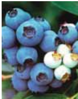
江南町のブルーベリー

『地域水田農業ビジョン』を策定し、市場重視の売れる米づくりを推進するとともに、農業構造改革を加速化