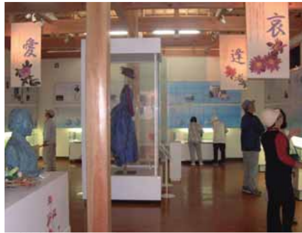
鹿鳴館スタイルの衣装をはじめ、吟子女史ゆかりの品々が数多く陳列された展示室