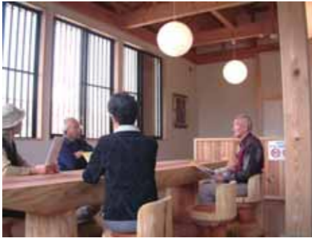
木のぬくもり漂う休憩室。観覧後はここで、ひと休みすることもできます。