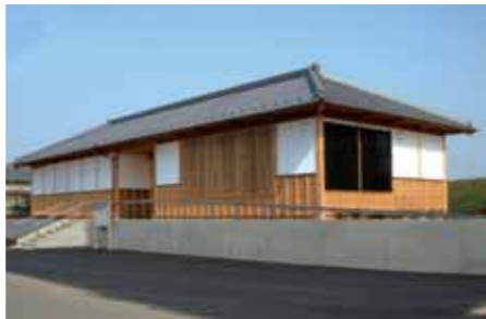
吟子女史の生家の長屋門を模して作られた記念館の外観

本市依瀬出身で、日本公許登録女医第1号となつた荻野吟子女史の記念館が、5月1日にオープンしました。栄光と波乱に満ちた吟子女史の生涯に、ぜひ触れてみてください。