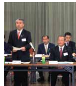
あいさつをする富岡市長