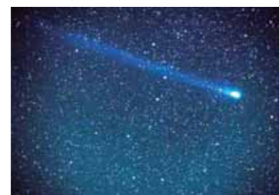
分裂して大彗星となった百武彗星