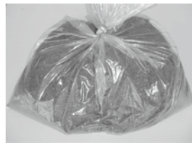
ダンボールコンポスト基材

◆環境政策課(江南庁舎) TEL 048-536-1548 ◆環境推進課(江南庁舎) TEL 048-536-1549 ※随時配布しています。 対象 家庭でダンボールコンポストを利用して生ごみ処理を行う方 環境推進課(江南行政センター2階) 配布数 100袋 (1世帯1袋まで)