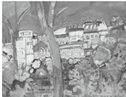
パリ風景 志邨武久 画