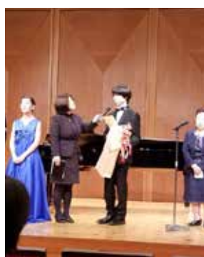
サントリーホールでの表彰式

演奏を極めるためにも早く海 外へ留学したいです。ピアノの 最高峰のショパンコンクールを目 指して、全てを音楽に捧げたい と思います。ただ、コンクールは 出発点で、最大の目標は、コン サートに長く来てもらえる、ファン に愛されるピアニストになるこ とです。昨年のおさくらめいとで のリサイタルを始め、熊谷の方 はいつも応援してくれて、本当 に感謝しています。有名になって 熊谷で凱旋コンサートを開きた いです。3月8日にさくらめい とで行うガラコンサートでは初 めてのピアノ協奏曲に挑戦しま す。熊谷の皆さんに僕のピアノ とオーケストラの対話をぜひ聞 いてもらいたいです。