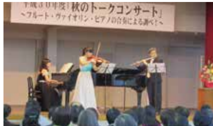
今年のコンサートの様子

定員 100人(先着順) 費用 300円 申込み 2月12日(水)から電話で受付