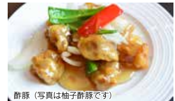
酢豚 (写真は柚子酢豚です)