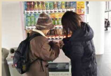
立正大学で開催の認知症高齢者声掛け訓練の様子