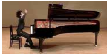
コンクール時の演奏

度できるかできないかと思っ ていますが、演奏時の手応えは いつもとは違いました。本番のピ アノには演奏の際に初めて触 るので、鍵盤の重さ、弦の固さ 等ピアノの個性をくみ取りな がら弾くのは大変難し いです。今回も、私の 情熱、作曲家の思いや 曲の背景を無我夢中で 表現しまし