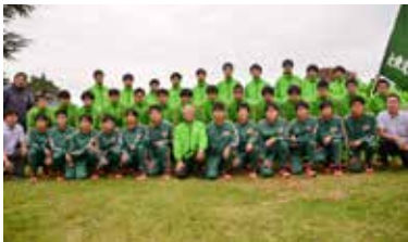
大東文化大学陸上競技部の皆さん