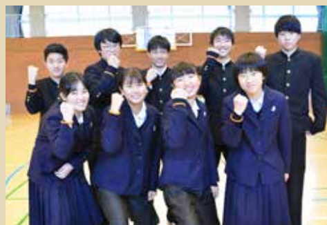
市内中学校の認知症サポーターの皆さん