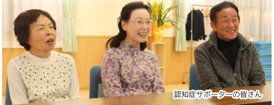
認知症サポーターの皆さん