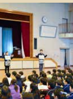
サポーター養成講座の様子

● 認知症は特別な病気ではなく、誰でもなる病気です。正しく理解して、地域で見守っていくことが大切だと思います。