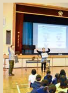
市内小学校で開催の認知症