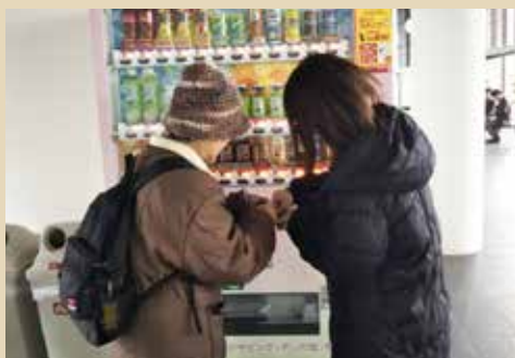
立正大学で開催の認知症高齢者声掛け訓練の様子