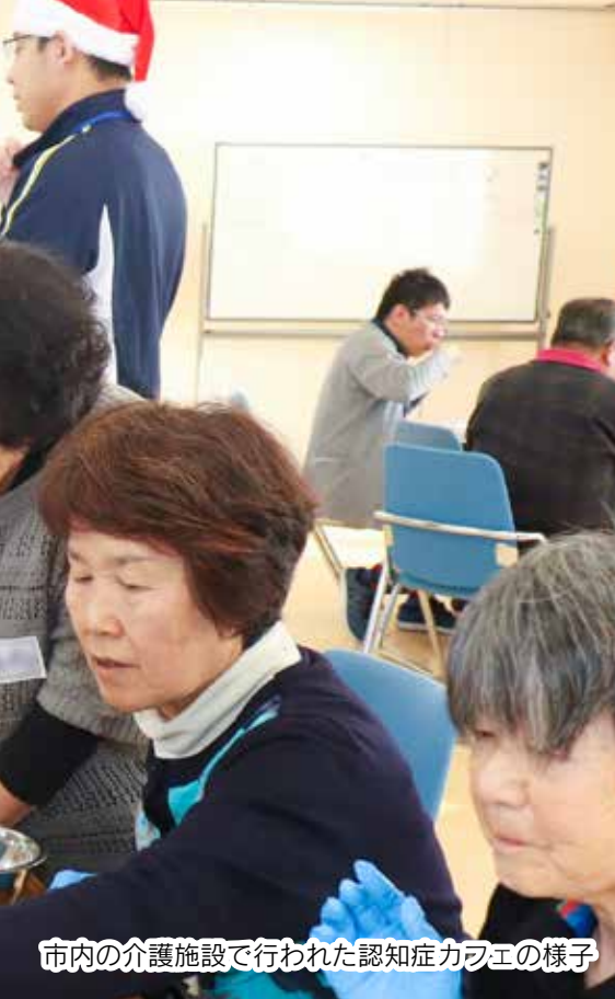
市内の介護施設で行われた認知症カフェの様子

今回は、認知症の方や家族が気軽に訪れることができる認知症カフェの運営者と、認知症サポーターに話を伺いました。