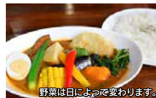
野菜は日によって変わります。