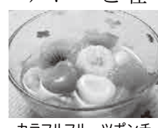
カラフルフルーツポンチ

対象 市内在住の小学生と保護者 とき 7月7日(土)10時〜12時30分 ところ 東京ガス株(銀座371) 定員 8組16人(先着順) 費用 1組500円(以降追加1人200円) メニュー ツナ入りナポリタン、カラフルフルーツポンチ 申込み 6月22日(金)までに電話で左記へ。 ◆環境推進課(江南庁舎) 048-536-1549