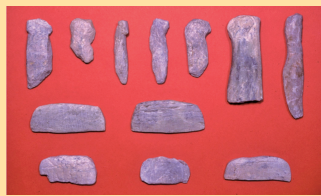
石製模造品 (埼玉県指定文化財)