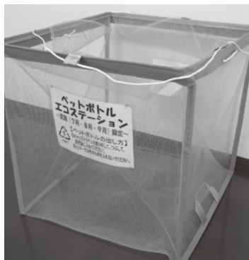
ペットボトル回収容器