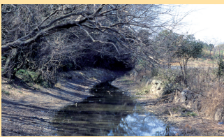
かつて祭祀場であり、湧水のあった堀が、湯殿神社北に今も残る

昭和38年、石製模造品が発見され、飛鳥時代から平安時代にかけて、かつて豊富な湧水があったこの場所、祭祀が行われていたことが分かりました。石製模造品とは、石で様々なもの(まが玉や剣など)をまねて作ったお祭りの道具です。