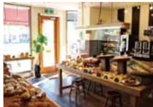
パンと、総菜と、珈琲と。PUBLIC BAKERY

◆(一社)熊谷市観光協会 ☎048-594-6677 (熊谷号を希望される方はご連絡ください。)