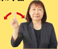
何 立てた人差し指を左右に振る

※左のコードから質問の手話の動画が見られます。 ※市ホームページ内の熊谷市チャンネルでもご覧いただけます。