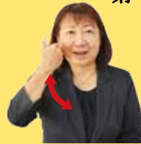
誰 右手の親指を立てて顔の横で振る