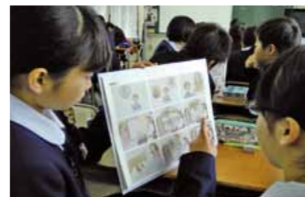
中学校英語科「ラウンドシステム」