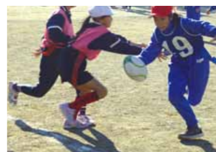
熊谷市親善タグラグビー大会