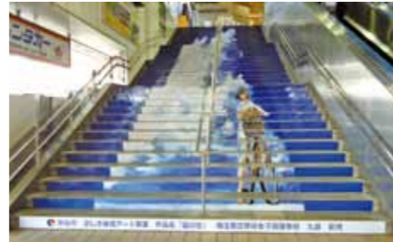
前回の最優秀作品(熊谷駅正面口)

・籠原駅北口西階段は、「中学生以下の部」として中学生以下の作品を優先的に展示します。