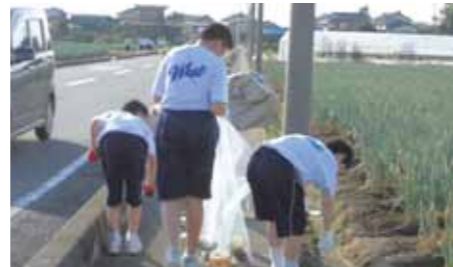
実生活における道徳の「見える化」