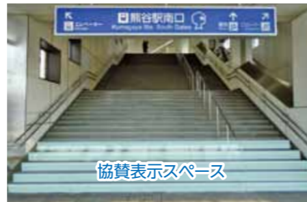
協賛表示の箇所(熊谷駅南口の例)

事業の趣旨にご賛同いただいた場合、特典として階段アートを展示する階段の一部に協賛表示を掲載します。