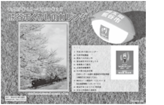
熊谷市くらしのカレンダー

年間行事予定や家庭こみの出し方、保健に関するお知らせなどを掲載した熊谷市くらしのカレンダーは、自治会を通しての配布のほか、市役所各行政センター等の公共施設でお配りしています。