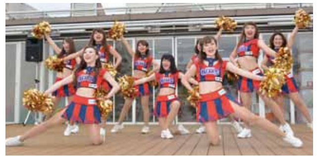
パフォーマンスをしているハニービーズ

いつも皆さんに元気をいただいているので、私たちがからも元気をお返しできるように、ダンスのレベルを高め、自分自身にも磨きを