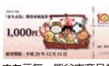
まち元気・熊谷市商品券

市の補助制度等の一部について、市内の登録店のみで利用できる熊谷市商品券を交付します。また、商品券の利用を希望する方に、窓口販売を実施します。(1億2830万円)