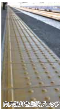
内方線付き点状ブロック

視覚障害者の旅客駅ホームからの転落を防止するため、JR籠原駅ホーム内の整備に対し、補助します。(1152万円)