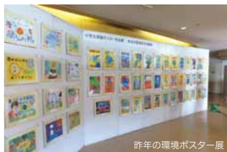
昨年環境ポスター展