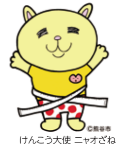
けんこう大使 ニャおざね

今月から特定健診のご案内を郵送でお送りしますので、自分や家族のために、特定健診・特定保健指導を積極的に利用しましょう。