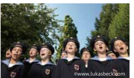
埼玉交響楽団第70回定期演奏会