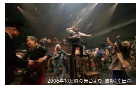
2006年初演時の舞台より