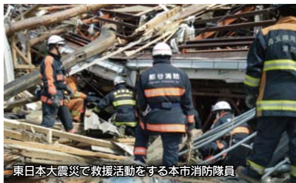
東日本大震災で救援活動をする本市消防隊員