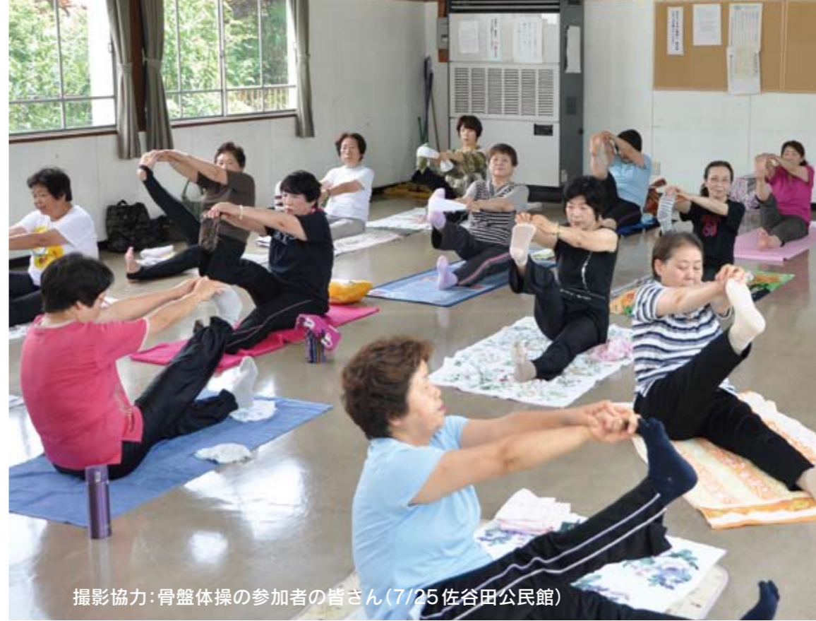
撮影協力：骨盤体操の参加者の皆さん(7/25 佐谷田公民館)

老人の日と老人週間は、広く高齢者福祉についての関心と理解を深めていただくとともに、高齢者自身の生活向上意欲を促すことを目的として制定されています。 本市では、高齢社会の将来像を「いきいきあんしん元気で長寿のまちくまがや」と定め、高齢者の皆さんが元気に、健康で生きがいを持って暮らせるまちを目指し、様々な事業を行っています。 ◆長寿いきがい課 内線 290