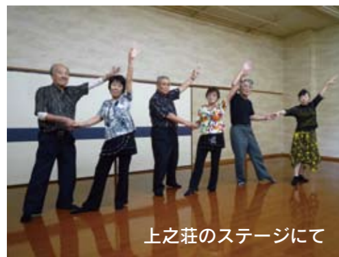
上之荘のステージにて

高齢者の健康増進、教養の向上およびレクリエーションの場として市内に4か所設置しています。集会所、娯楽室、浴室、訓練室、相談室等の施設があります。将棋やカラオケ等を楽しみながら、地域の皆さんとの交流の場としてご利用ください。