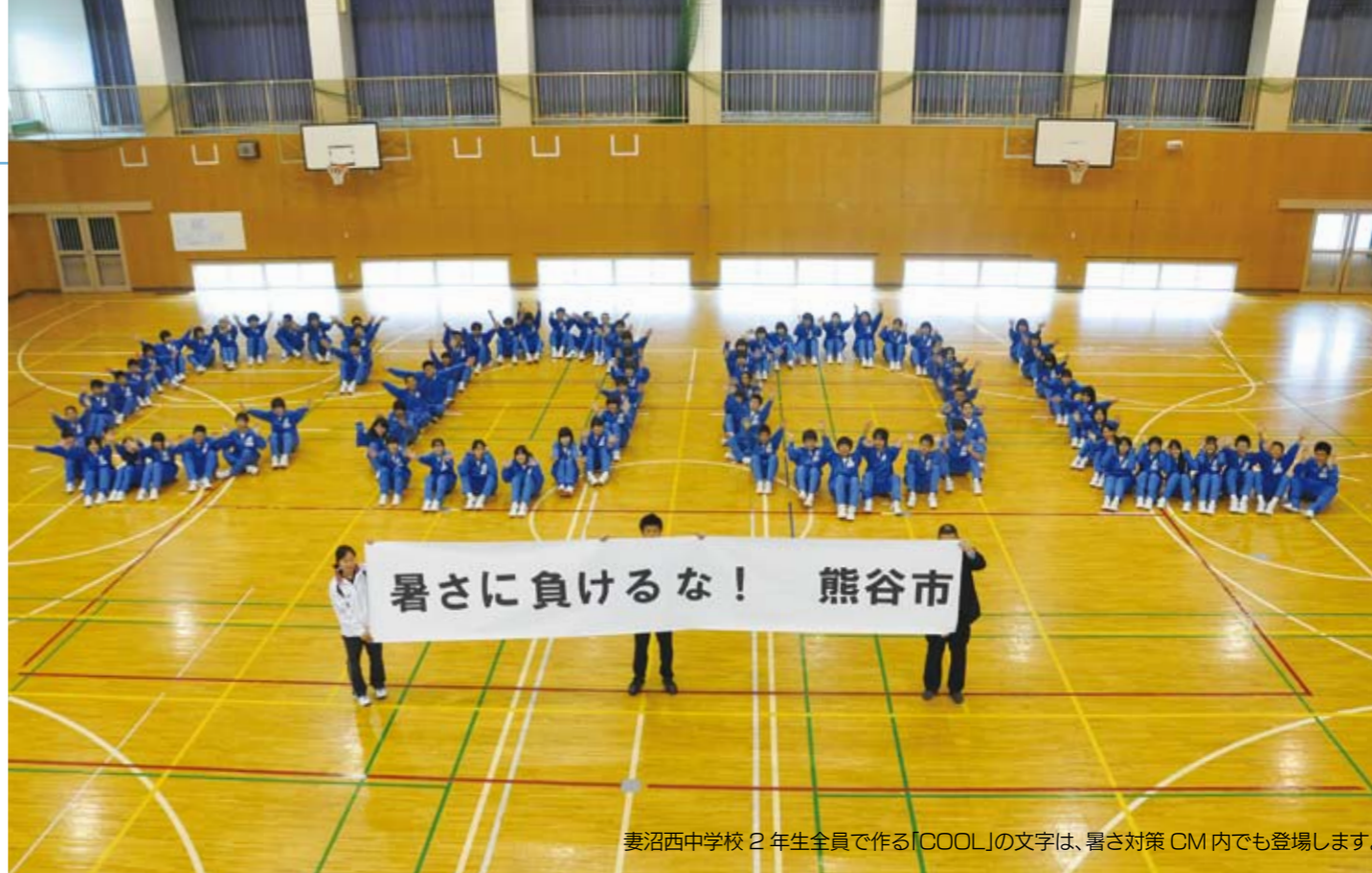
妻沼西中学校 2年生全員で作る「COOL」の文字は、暑さ対策CM内でも登場します。