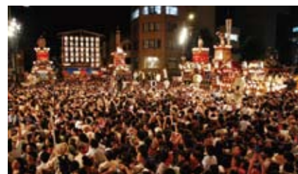
曳合わせ叩き合い