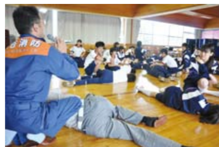
熱中症予防講習の様子(6月15日別府中学校) 熱中症症状が出た方に対する回復体位の取り方など、実践的な内容も取りこまれました。

熱中症の発生の危険性は、湿度が高いほど、運動強度が強いほどに高まります。熱中症にならないために次のことに注意しましょう。