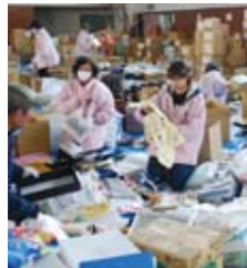
支援物資の仕分け

籠原駅に新しい顔がオープン 3月20日、JR籠原駅北口に、多様な子育てニーズに応える駅ビル「E SITE 籠原」がオープンしました。親子で楽しめるショップが多く、3階には認可保育園も併設されています。