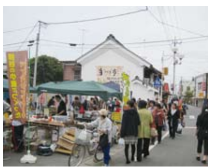
多くの人でにぎわう熊谷妻沼手づくり市

熊谷妻沼手づくり市の詳しい情報は、こちらのブログをご覧ください。 熊谷妻沼手づくり市ブログ http://menuma00tedukuri.blog71.fc2.com/