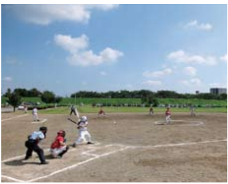
スポーツ等で活用される荒川緑地

有効活用される河川敷 荒川の土地利用の特徴的なところは、約61%が国有地以外の土地(約51%が民有地、約10%が県有地などの公有地)になっていることで、利根川など、荒川以外の関東地方の主な河川での平均値が約21%であることに比べ、非常に突出しています。本市は、荒川の中流域にあり、その河川敷は公園・緑地、ゴルフ場、農耕地等で活用されており、荒川緑地や荒川大麻生公園等を中心とし、スポーツ・レクリエーションの場として有効利用されています。