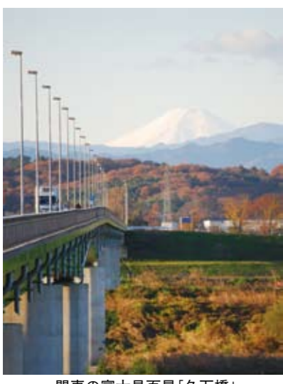
関東の富士見百景「久下橋」

荒川大麻生公園の河原は、県内平地で最大規模のカワラナデシコの生息地です。また、堤防上はサイクリングロードとしても整備され、ハイキングにも最適です。熊谷桜堤には、約500本もの桜(ソメイヨシノ)が植えられ、毎年花見客で賑わいを見せています。1990年(平成2年)には、「日本さくら名所100選」にも選ばれました。