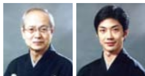
野村万作 野村萬斎

Pコード<409-499>・<プレイガイド> 映画「のぼうの城」とは違う狂言師の萬 斎。そして父万作の演目を、堪能ください。 とき 10月28日(金)18:30 開演 前売開始 6月23日(木) 料金 全席指定 S /4,500円 Sフレンド(2枚以上同時購入) /4,000円 A /3,500円 高校生以下 /1,000円(共通)