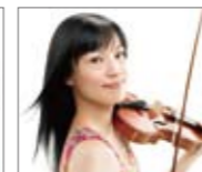
森麻季 (ソプラノ) 千住真理子 (ヴァイオリン)