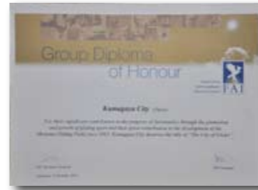
「グループ・ディプロマ・オブ・オーナー」の賞状

熊谷市は昨年、これまでのイベントなど、市民が参画したグライダースポーツの振興に多大な貢献をしたことが評価され、国際航空連盟(FAI)の「グループ・ディプロマ・オブ・オーナー」を受賞しました。