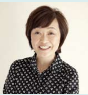
ゲストランナーの紹介 スポーツジャーナリスト 増田明美さん