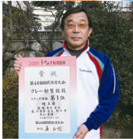
ご自宅で国体優勝の賞状とともに

20代で飛び込んだ射撃の世界 30年以上前まだ20代だった頃、知人に射撃場に連れて行ってもらった機会がありました。そこで、初めて見たクレイ射撃の世界に、一目で虜になりました。何かを見つけた感覚というか、「これをやるんだ！」という強い思いがあり、すぐに始める決意をしましたね。 射撃をするには免許が必要ですが、銃の性質上、取得要件は厳格です。申請には同居親族の同意が必要でね。両親は初め反対しましたが、最後は私の説得に負け、認めてくれました。 とにかく撃つことで先が見える