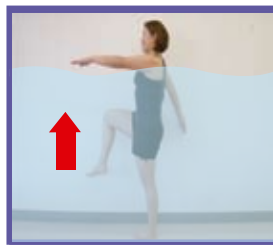
力強く歩くことで効果倍増!

両手を大きく上げ、水をかきながら前進します。このとき歩幅も大きく広げることで、脚の筋力アップが図れます。