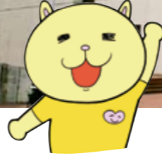
ニャオざね