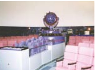
10,000個の星を映す本体投映機

ニャオざね 企画展では何を展示しているのにかにや? 博士 熊谷ゆかりの美術、歴史、民俗、自然科学の分野のテーマを決めて展示している。国の重要文化財を展示したこともあるにや。展示室の広さは、県内の博物館ではトップクラスなんにや。