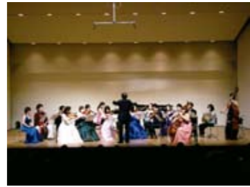
クラシック演奏会

博士 では、今度は文化会館を案内するにしよう。文化会館には、500席のホールと練習室が3部屋、楽屋が2部屋あるにや。 ニャオざね ホールはどんなことに使われているのにかにや? 博士 演奏会や発表会などの催しから研修会までいろいろにや。舞台照明や音響装置もそろっているから本格的な芸術活動もできるぞ。ニャオざねもどうにや。