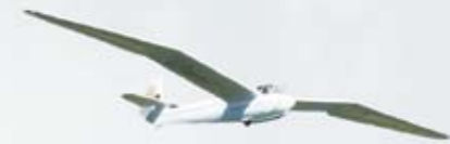
ミニモア