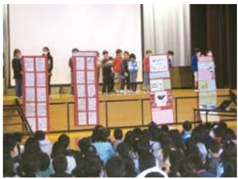
ごみについて調べよう (4年生)