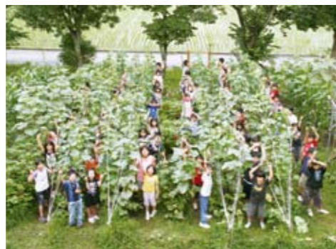
学校ファームで収穫した喜び

また、家庭や地域の協力を得て、資源回収・奉仕作業・放課後子ども教室などを行っていきます。その他にも地域の皆さんの指導により、米作りや、江南地区で盛んな青大豆・キノコの収穫・ブルーベリー摘みなども体験できました。