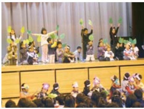
あさがおを そだてたよ (1年生)

5月にあさがおの種をまき大切に育てました。あさがおの世話の仕方や成長の様子をみんなで劇や歌にして発表しました。黒い小さな種からたくさんの葉やつるが出て次々ときれいな花が咲き、楽しみながら観察できました。