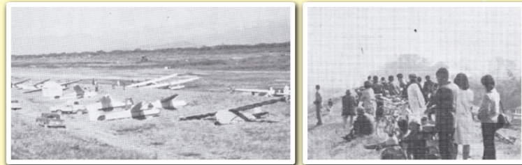
昭和42年当時の妻沼グライダー滑空場の様子