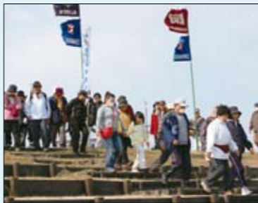
利根川堤を歩こう会

野外コンサート 同時開催「利根川堤を歩こう会」参加者募集 妻沼中央公民館からグライダーフェスタ会場までの、片道約5kmを歩きます。 とき 3月6日(土) 9時(集合)・9時30分(出発) 集合場所 妻沼中央公民館(妻沼東1-1) 費用 無料 ※グライダーフェスタ会場に着後、自由解散。