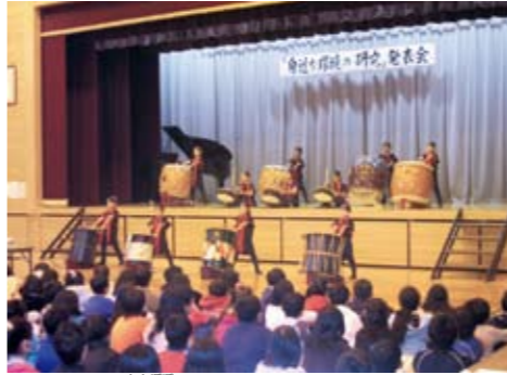
「鼓草」による太鼓演奏

春の桜、爽やかな小鳥のさえずり、秋の紅葉から熊谷市の軽井沢とも呼ばれる江南の四季の変化や里山の自然、動植物を題材として、自分たちを育ててくれた学校の周りの環境について調べました。 また、自分たちの周りを花と緑いっぱい環境にしようと考え、コリウスやラベンダーなどの挿し木で卒業記念樹を作りました。