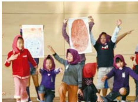
ブルーベリーについての寸劇(3年生)

野菜や草花の栽培をしました。なかでも江南北地区の特産物であるブルーベリーについて、調べたことを劇にして発表しました。