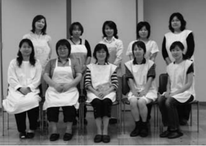
私たち訪問相談員がお伺いします!

7月からは赤ちゃん事業 市では、子育て支援事業の一環として、平成21年5月以降に生まれたお子さんのいる全ての家庭を対象に、お子さんの体重測定や育児の相談をお受けする「こんには赤ちゃん事業」を開始します。 生後2～3か月頃に、市から委託を受けた、訪問相談員(保健師、助産師)が事前に訪問日時等の連絡をしたらうえで、ご自宅にお伺いします(申込みは必要ありません)。 ◆健康づくり課