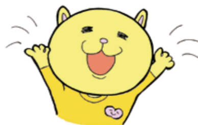
市民活動イメージキャラクター「ニャオざね」