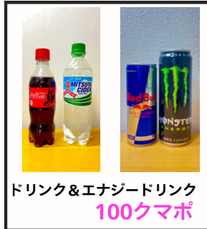
ドリンク&エナジードリンク 100クマポ