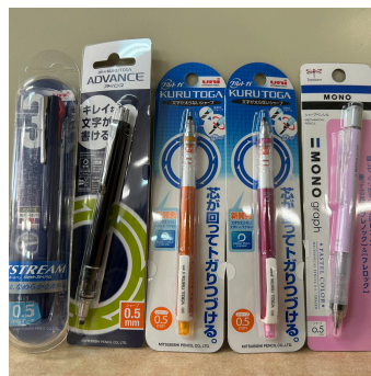
500 クマポ賞 ボールペン・シャープペン クマポタオル