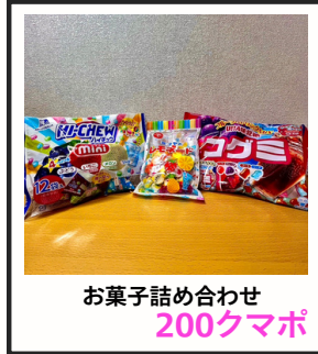
お菓子詰め合わせ 200クマポ