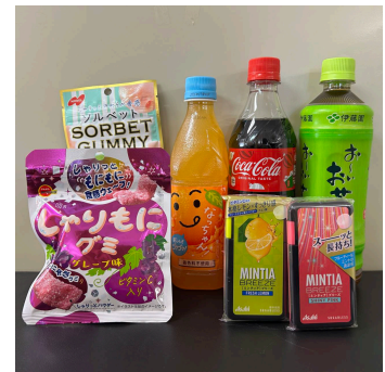
200 クマポ賞 飲み物・お菓子・ クマポハンカチ

主催：クマポ大学～立正大学 × クマポ～ 協力：立正大学研究推進・社会貢献センター 熊谷市市民活動推進課