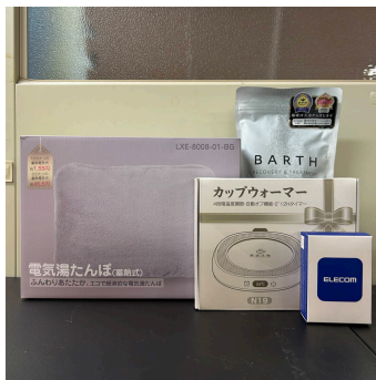
2,000 クマポ賞 電気湯たんぽ・ カップウォーマーなど