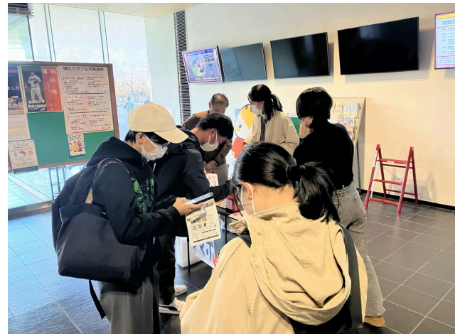
写真2 11/18から人通りの多い出入口付近へ