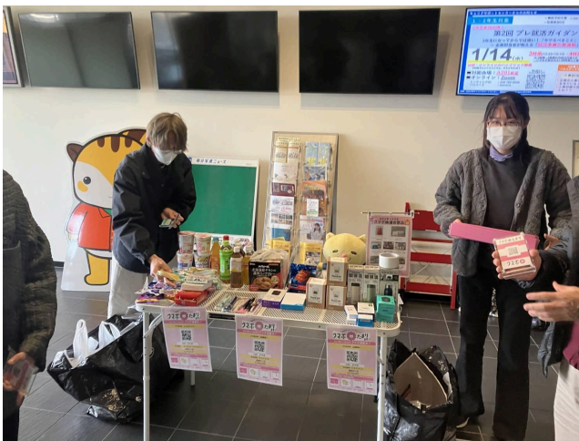
写真7 抽選会の景品、多くの学生の参加