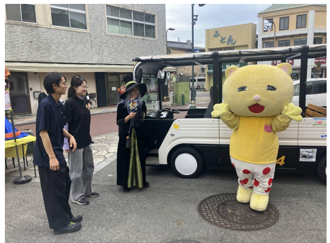
写真4 ニャオざねも登場