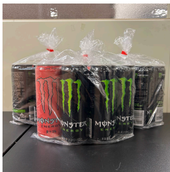
1,000 クマポ賞 エナジードリンク 詰め合わせ