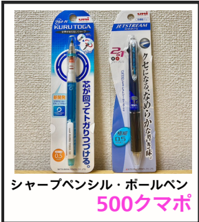
シャープペンシル・ボールペン 500クマポ