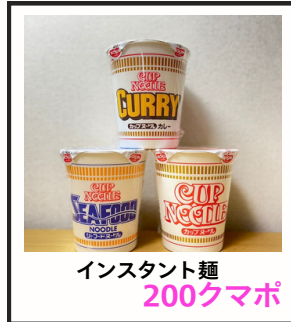
インスタント麺 200クマポ