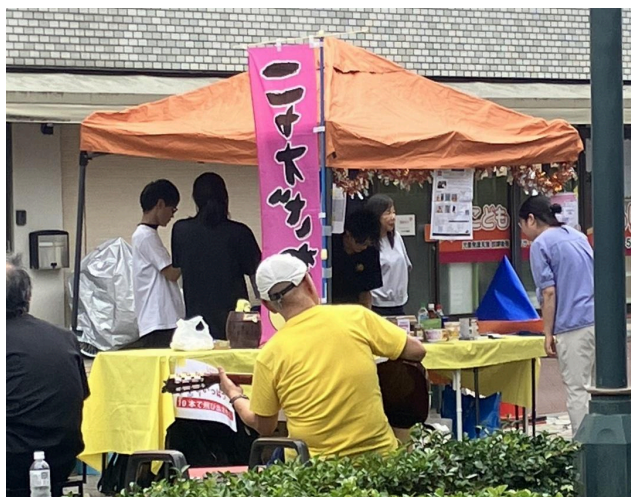
写真3 PRブースにて活動を紹介