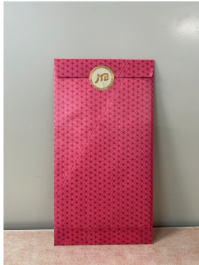
クマポ大学賞 ディズニーランドペア チケット相当旅行券