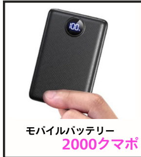
モバイルバッテリー 2000クマポ