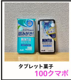
タブレット菓子 100クマポ