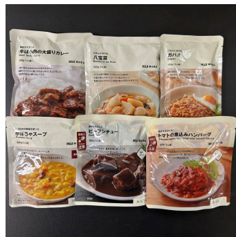
2,000 クマポ賞 レトルト食品セット