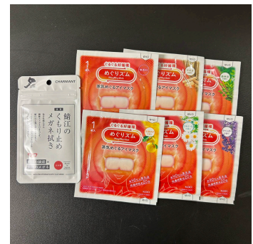
1,000 クマポ賞 メガネふき・ ホットアイマスク