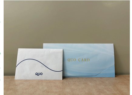
くまがや賞 QUO カード