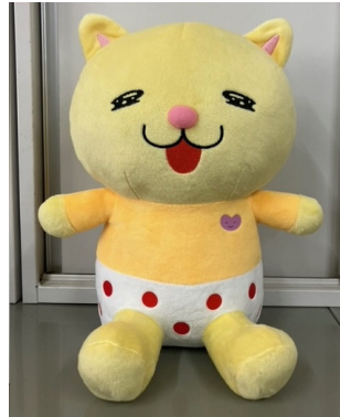
ニャオざね賞 ニャオざね ぬいぐるみ