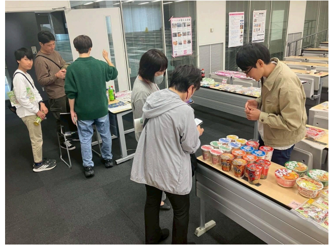
写真5 熊谷クイズを実施、盛り上がりました！ 写真6 記念品交換も実施、壁沿いに掲示物